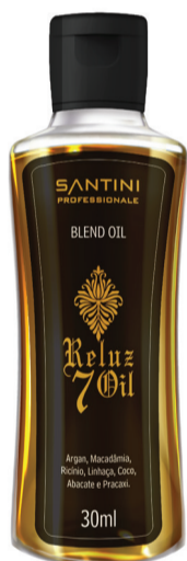
Reluz 7 Oil 30ml

Um blend dos poderosos 7 óleos que possui ação anti-aging, é um potencializador de tratamento, promove umectação e ação reparadora.