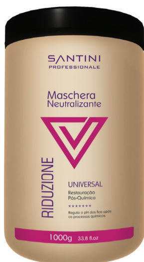
Maschera Neutralizante 1000g Rentabilidade: 40 aplicações