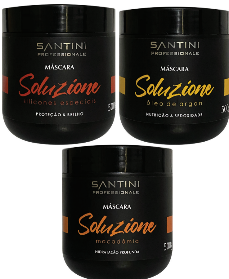
Soluzione 500g Rentabilidade: 20 aplicações

Aplicação: Após lavar os cabelos com o shampoo Red Color , aplique pequenas quantidades em mechas, distribua por toda a extensão dos fios. Deixe agir por 45 minutos e enxágue em seguida. Utilize um dos finalizadores Santini e finalize como desejar.