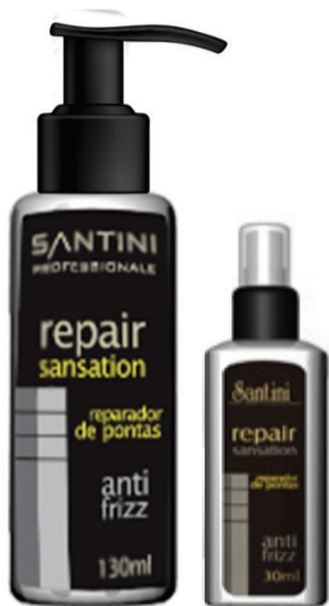
Reparador Repair 130ml Reparador Repair 30ml

Aplicação: Aplique a uma distância de 15 cm vaporizando de forma expansiva. Aguarde até que ele volatilize, deixe secar e penteie.