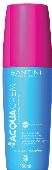
Acqua Crem 150ml