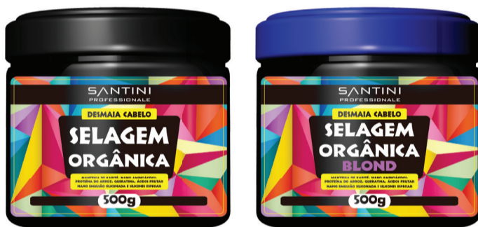
Selagem Orgânica 500g Rentabilidade: 10 aplicações

A selagem orgânica é um realinhamento sem formol, que foi desenvolvido para realinhar os fios e redução de volume, promovendo um efeito de liso natural e brilho intenso aos fios.