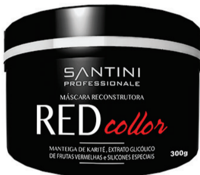
Red Collor 300g Rentabilidade: 15 aplicações

A linha Red Collor foi elaborada com alta tecnologia para reavivar a cor avermelhada que os cabelos perdem com o passar do tempo.