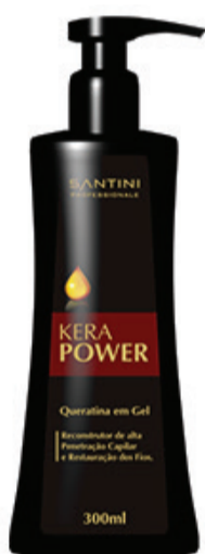
Keratini Kera Power 300ml Rentabilidade: 30 aplicações

Aplicação: Após retirar a química dos cabelos aplique a máscara Neutralizante na base dos fios estendendo até as pontas, massageie e enxágue. Aplique novamente o produto e deixe agir por 06 minutos . (Em químicas com hidróxidos ou tioglicolato enxágue os cabelos até que a espuma não tenha tonalidade rosa). Finalize com um de nossos finalizadores.