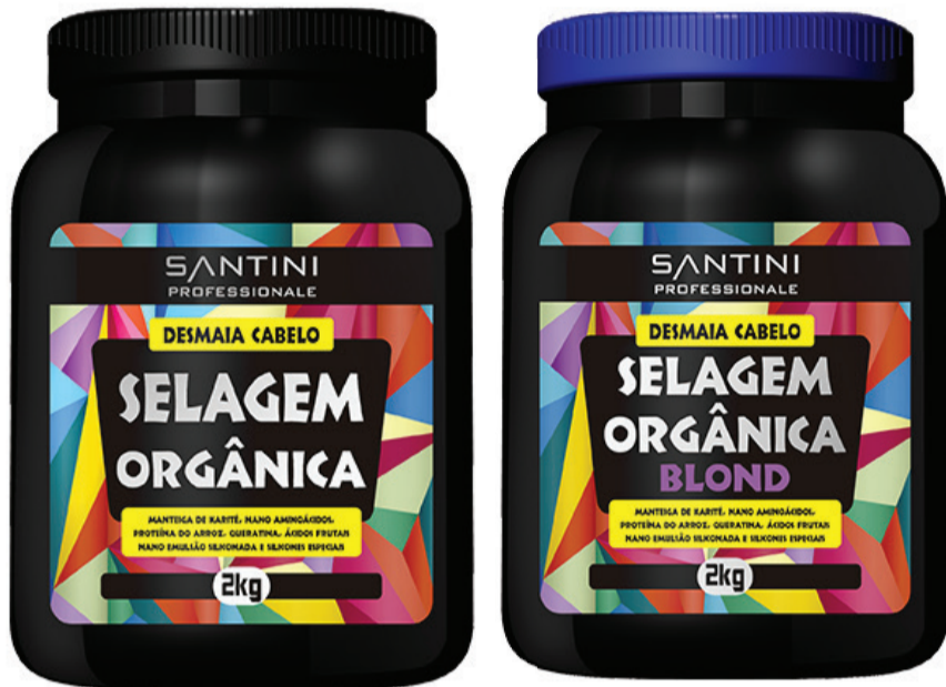
Selagem Orgânica 2Kg Rentabilidade: 40 aplicações