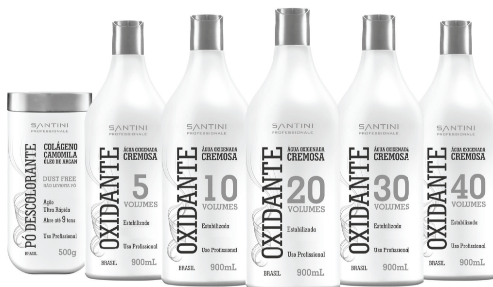
Pó decolorante 500g

Benefícios: Ação antioxidante, antiressecamento e antiqubra. Maior durabilidade da cor, brilho e vitalidade aos cabelos.