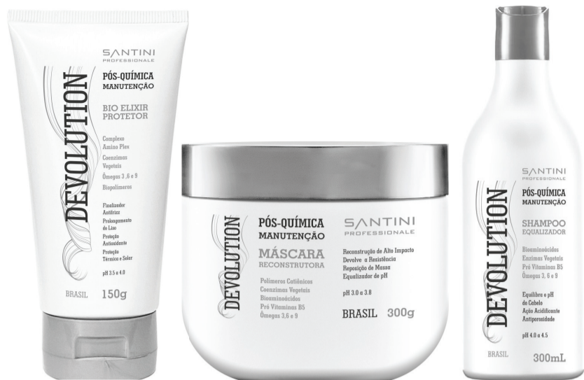
Shampoo Devolution 300ml Máscara Devolution 300g Bio Elixir Protetor 150g

A linha Devolution Home Care foi desenvolvida para a manutenção do tratamento Devolution Pós Química, assim os benefícios proporcionados são mantidos e intensificados.