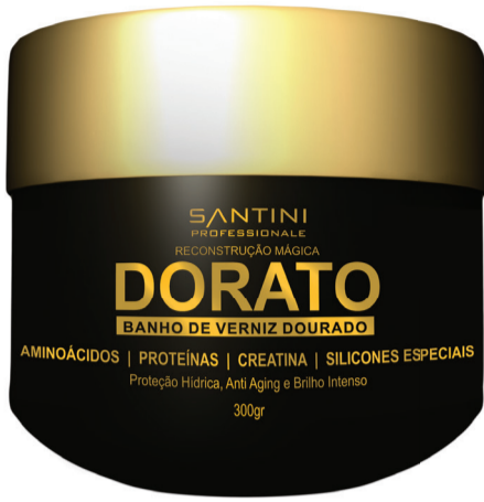
Dorato 300g Rentabilidade: 15 aplicações

Rica em Mica, a Máscara Dorato transfere e resgata o brilho intenso a todos os tipos de cabelos, além de repor massa capilar com o exclusivo efeito Pro Filler .