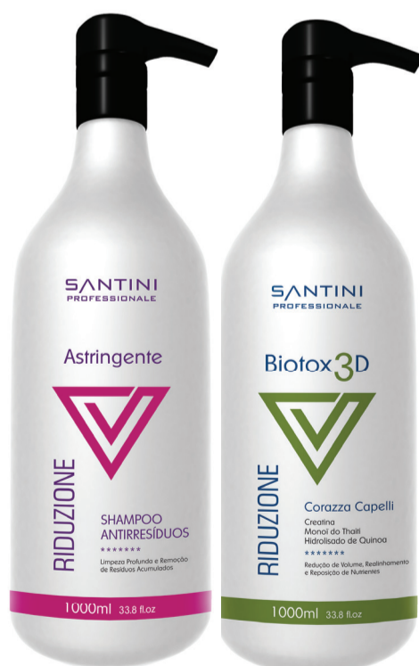
Shampoo Astringente 1000ml Biotox 3D 1000ml Rentabilidade: 30 aplicações

Nosso Biotox 3D proporciona uma hidratação oclusiva e ação redutora de volume. Devolve as propriedades naturais como brilho e movimento aos cabelos secos e desalinhados.