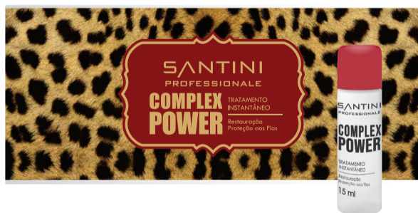
Ampola Complex Power 15ml Rentabilidade: 3 aplicações

Aplicação: Opção 1. Após lavar os cabelos com um Shampoo Santini de sua preferência, com os cabelos úmidos, aplique uma pequena quantidade da ampola Complex Power nas mãos ficcione-as e aplique sobre toda extensão dos fios enluvando bem. Deixe agir de 3 a 5 minutos e enxágue abundantemente. Opção 2. Despeje o conteúdo da ampola Complex Power em um recipiente e despeje a água aos poucos, mexendo até que forme um mousse. Aplique sobre toda a extensão dos fios e deixe agir de 3 a 5 minutos e enxágue abundantemente. Dica: Utilize para finalizar um leave-in da linha Santini.