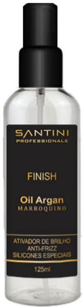
Finish Oil Argan 125ml