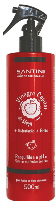
Vinagre Capilar de Maçã 500ml